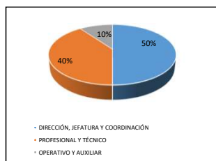
GRÁFICO N° 1 ESTRATO DEL CARGO